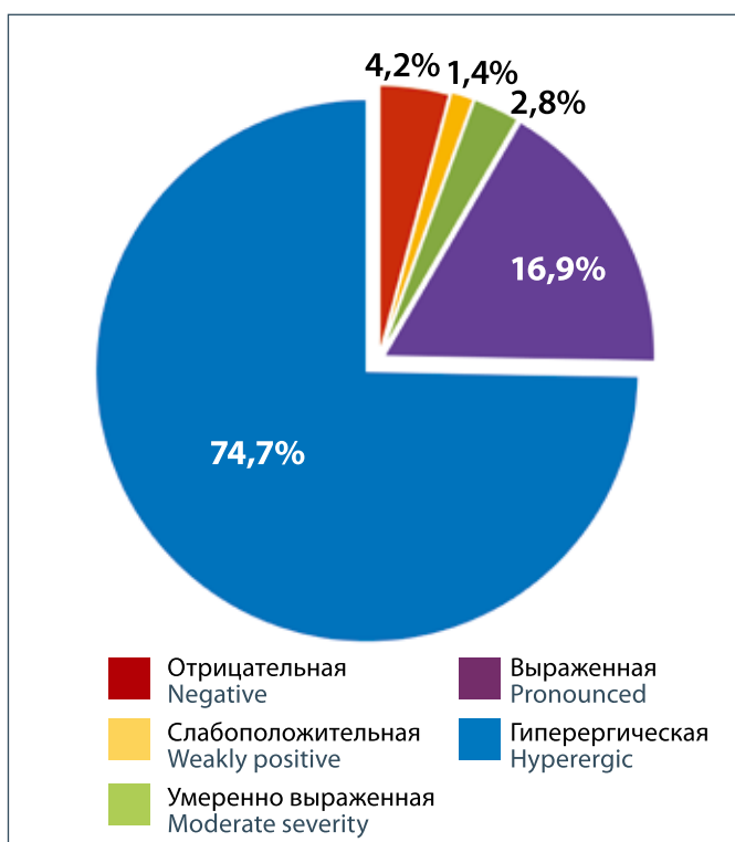
Рисунок 1. Результаты кожных иммунологических проб с АТР при выявлении посттуберкулезных изменений Figure 1. Results of skin immunological tests with ATR in the detection of post-tuberculosis changes

Большинство детей (70 человек, 98,6%) были вакцинированы вакциной БЦЖ-М. Местные прививочные знаки не обнаружены у 26 (36,6%) привитых. Рубцы сформировались у 44 детей (62,9%): маленькие (2–4 мм) и хорошо развившиеся рубцы встречались одинаково часто – по 50% случаев. Один ребенок не был привит против туберкулеза в связи с контактом по ВИЧ-инфекции (R75). Среди детей с впервые выявленными посттуберкулезными изменениями туберкулезный контакт был установлен у 30 (42,3%) пациентов. При этом в 73,3% случаев у источника инфекции имело место бактериовыделение. У каждого второго ребенка (41 из 71 чел., 57,7%) туберкулезный контакт не был установлен. Среди источников инфекции с наличием бактериовыделения (у 22 детей) у каждого третьего (8 случаев, 36,7%) сохранялась чувствительность микобактерии туберкулеза (МБТ) к противотуберкулезным препаратам; устойчивость к изониазиду